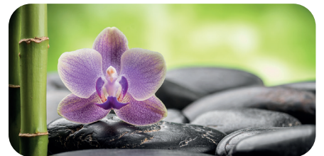
soni PICTURE "orchid"