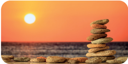
soni PICTURE "balanced stones"