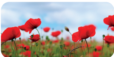
soni PICTURE "red flower"