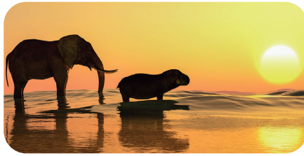
soni PICTURE "oasis"