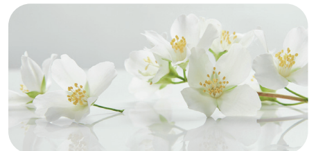
soni PICTURE "jasmine flowers2"