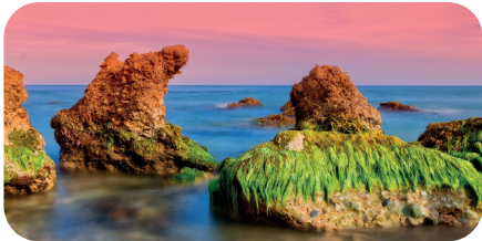
soni PICTURE "moss-covered rocks"