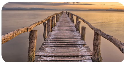
soni PICTURE "lake view"