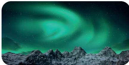
soni PICTURE "polar lights"