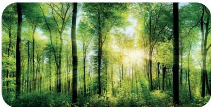
soni PICTURE "sun-drenched forest"