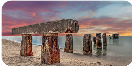
soni PICTURE "megalith"