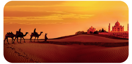
soni PICTURE "desert town"