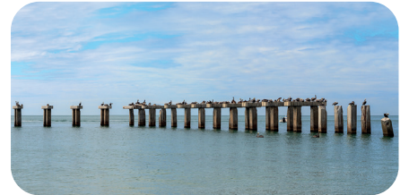
soni PICTURE "seabird"