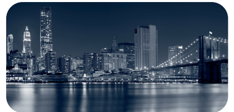
soni PICTURE "night skyline"