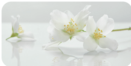
soni PICTURE "jasmine flowers1"