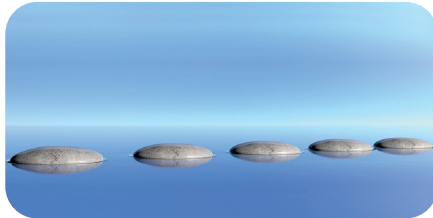
soni PICTURE "rounded stones"