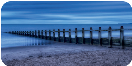
soni PICTURE "pier"