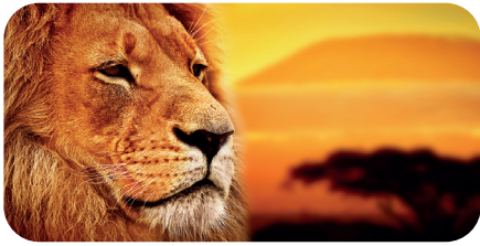
soni PICTURE "lion"