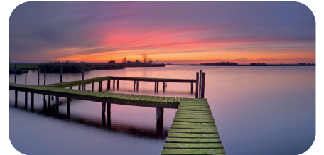
soni PICTURE "boardwalk"