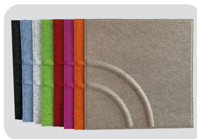
soni COLOR Design Wave