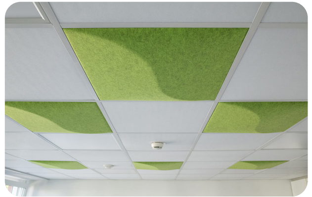
Bsp. Deckengestaltung mit soni COLOR Design YinYang