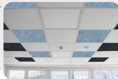
Techo reticulado: soni COMFORT SD y soni COLOR RD