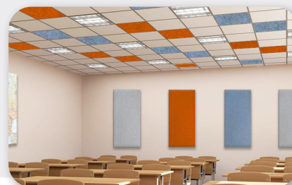
Techo: soni COLOR RD / Pared: soni COLOR