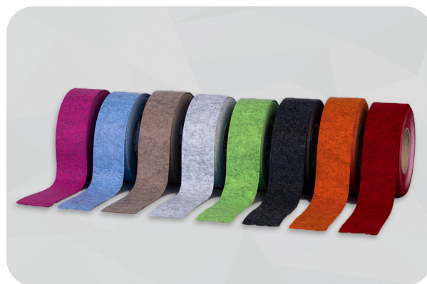
Cintas de fieltro soni VLD