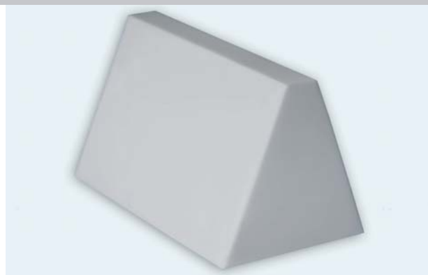
soni TRAPEZ, grau. Auch in weiß erhältlich.

Anwendungen: Überall, wo der Schallpegel reduziert werden soll und dabei Brandschutzbestimmungen erfüllt werden müssen. Besonders geeignet, wo Kranbahnen, Luftkanäle, Lampen o.ä. eine großflächige Anbringung von Verkleidungen erschweren.