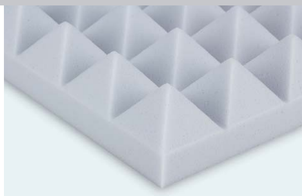
soni PYRAMIDE, grau. Auch in weiß erhältlich.

Anwendungen: Überall, wo der Schallpegel reduziert werden soll und dabei Brandschutzbestimmungen erfüllt werden müssen.